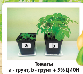
Томаты а - грунт, б - грунт + 5% ЦИОН