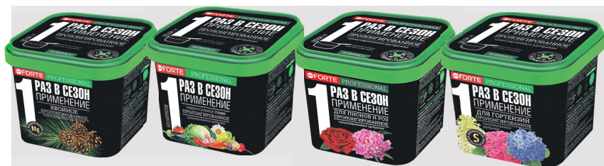
Хвойное 1л TURBO универсальное 1л Для пионов и роз 1л Для гортензий 1л гранулированные пролонгированные премиум удобрения с биодоступным кремнием

Произведено по уникальной передовой технологии « SIIOG », обеспечивающей важные качественные преимущества перед традиционным смешением: